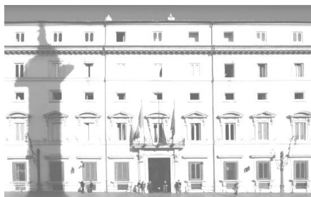
Governo - Ministero della Giustizia

Il Consiglio dei Ministri si è riunito venerdì 16 giugno 2017 ed ha approvato: