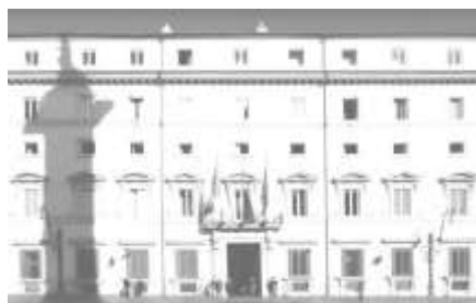
Governo - Ministero della Giustizia